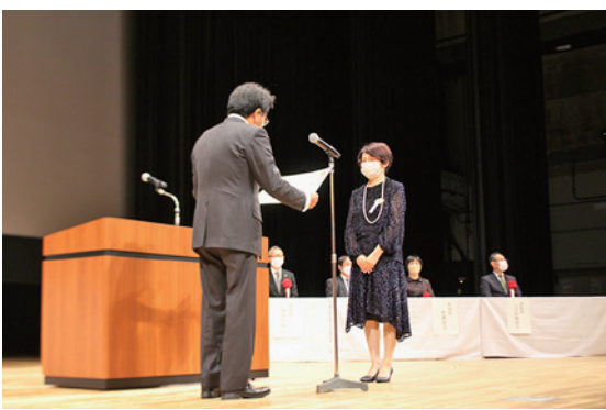
写真1 日本家族計画協会会長表彰の様子

式典の冒頭、加藤勝信厚生労働大臣(代読)山本圭子子ども家庭局母子保健課長)があいさつし、2023年度のことばも家庭庁の設置や、ことも基本法の制定、第8次医療計画の策定に向けた検討、産後ケア事業の推進など、子ども政策をめぐっては様々な動きがある。その一環として、成育基本法に基づく基本方針についても現在見直し