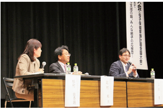
写真2 パネルディスカッションの様子

の検討を進めていると語り、各分野の施策の相互連携を図りつつ、子ども連帯を築き、子ども連帯の権利を尊重した成育医療等が提供されるよう、横断的な視点での取り組みも推進していくと表明。母子健康手帳の見直しとともに、マイナンバーカードを活用したデジタル化の推進に向けた議論も進められていると述べ、これらの取り組みを通じて、各市町村や医療機関における切れ目のない包括的な支援の提供を推進