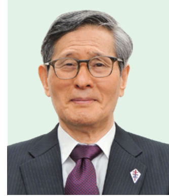
公益財団法人結核予防会理事長 新型コロナウイルス感染症分科会会長 尾身 茂

2020年から分科会 会長の役を3年務めさせ ていただいております。 当初はこんなに長く続い ては思っておりませんし とは思っています。その 間、3人の総理大臣の下、 官僚群も結構替わって、 我々だけが古株になって いる状況です。