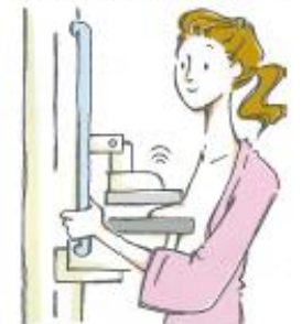
左右の乳房を片方ずつ透明の圧迫板で挟み、薄く引きのばした状態で撮影します。

乳腺密度の高い若年者や授乳中の方、乳房の手術後の方などは、マンモグラフィだけでは発見が難しい場合があります。約10~15%で発見できない恐れがあります。